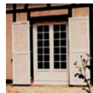
Fenêtre et porte-fenêtres PVC